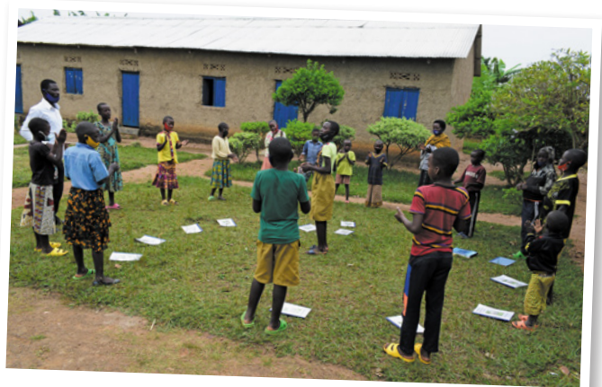
Een samenkomst van een van de kindgroepen