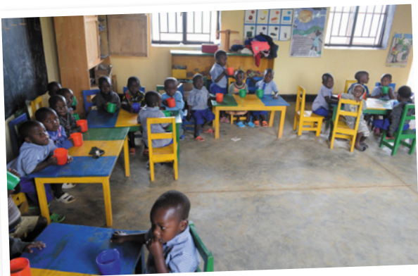
De kinderen op de peuter- en kleuterschool eten gezellig samen